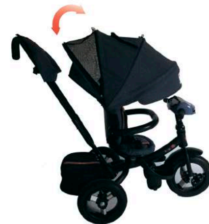
Функция вентиляции капюшона