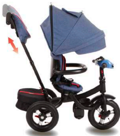
Телескопическая ручка управления