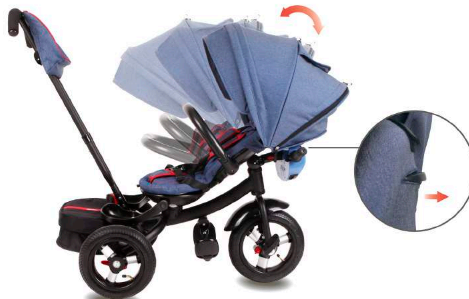
Сзади спинки отожмите рычаг вверх и наклоните спинку сиденья до нужного положения