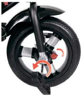
Функция свободного колеса